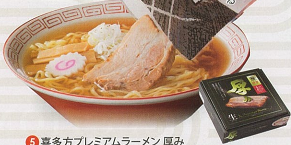
5 喜多方プレミアムラーメン 厚み ¥2,117 (税込) 経

特定原材料：小麦 内容量：生麺 120g×4 醤油スープ35g×4 チャーシュー 25g×4 メンマ50g×1 賞味期限：45日 (株)河京