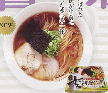
6 横浜戸塚 支那そばや

特定原材料：小麦 内容量：生麺 120g×4 醤油スープ35g×4 チャーシュー 25g×4 メンマ50g×1 賞味期限：45日 (株)河京