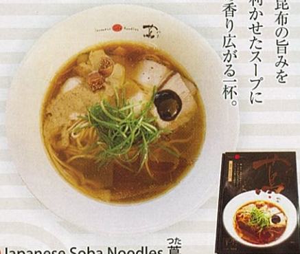
7 Japanese Soba Noodles 鰻 1,188 (税込) 経

特定原材料：小麦、卵 内容量：ストレート細麺90g×3 醤油スープ50g×3 賞味期限：90日 (株)アイランド食品